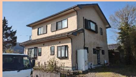
北西面は朝露が外壁に残っていました。