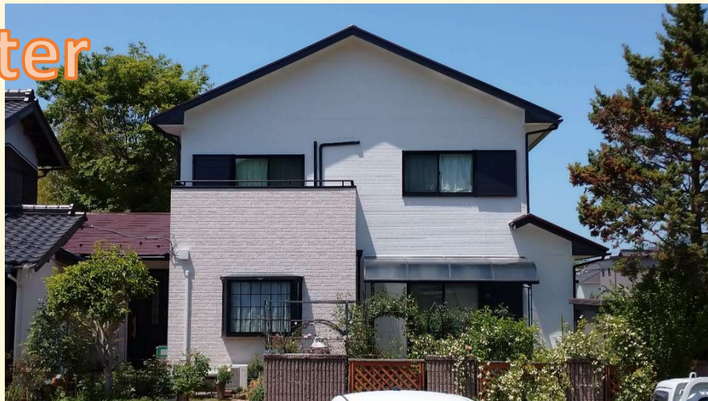
新しく張り替えたレンガ積み調の外壁が、白く塗装した外壁の中で映えて見えます！