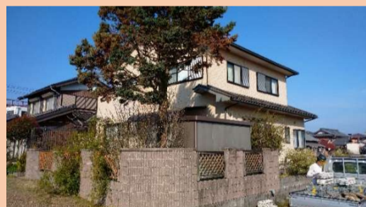
黒い屋根とベージュの外壁をどの様に塗り替えるか、じっくり考えました。