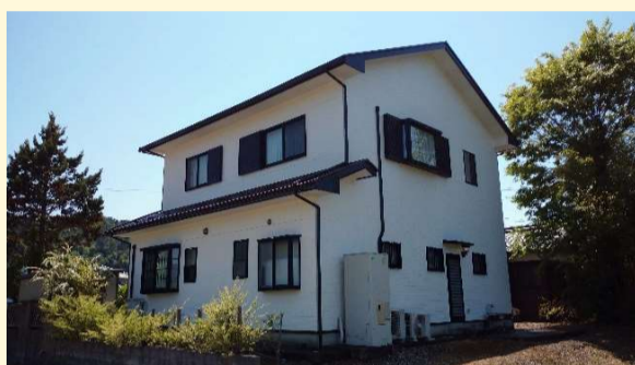
新しい塗装塗膜が朝露を弾いてくれる様になり安心です！