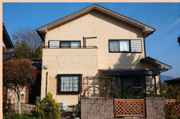
東面は日当たりが良く、外壁の劣化が進んでいました。