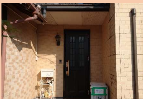
玄関右側の外壁の腐食が長年のお悩みでした。