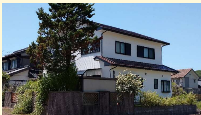
茶色い屋根と白い外壁、黒い窓がバランス良く仕上がりました！