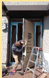
取り外した開口に新しい玄関ドアサッシを取り付けていきます。