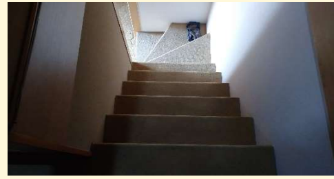
玄関ホールから階段へと続く絨毯貼りの床の劣化と汚れが気になっておられました。