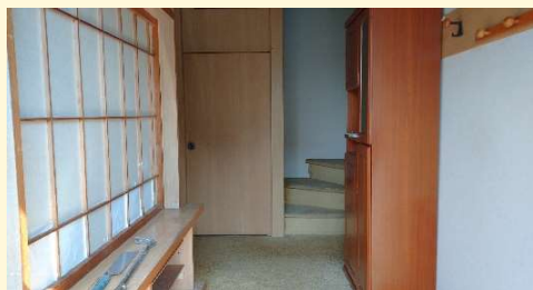
写真左手の玄関収納兼隣室の和室との明り取り障子が玄関ホールに圧迫感を与えていました。