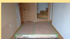
大工さんの造作工事が終わり、壁と天井にビニルクロスを貼っています。