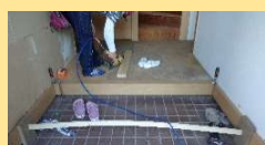
床の絨毯を撤去し、玄関ホールと廊下には新しいフローリングを貼っています。