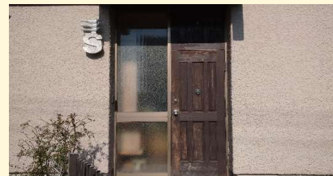
頑丈な木製ドアでしたが、日焼けや経年劣化で反りも発生し、虫の侵入にお悩みでした。