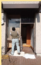
古い玄関ドアとFIXのガラス、アルミ枠を解体撤去しています。