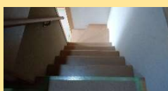
階段は絨毯を撤去し、リフォーム階段という商品を取り付けていきます。