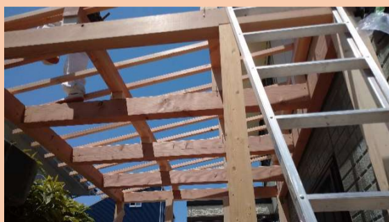
計画通りに柱や梁を組んでいます。