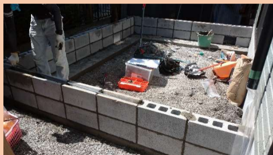
建物の寸法と高さに合わせて施工しています。