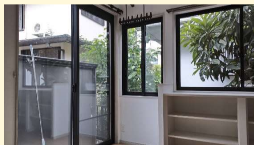
洗濯物干しスペースには既存の外部建具を移設し、ふんだんに光が入る様にしました！