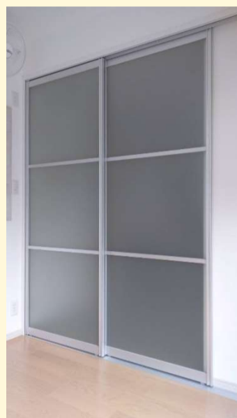
既存のお住まいとの出入りにはアルミ建具を使用しました！