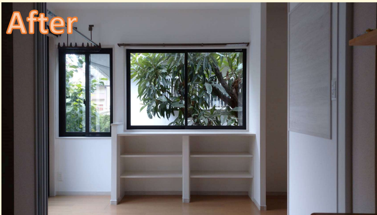
S様の思いが詰まったお部屋が完成しました！