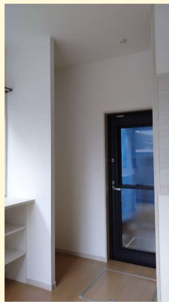
お庭のウッドデッキからも出入りできる様に勝手口を設置しました。