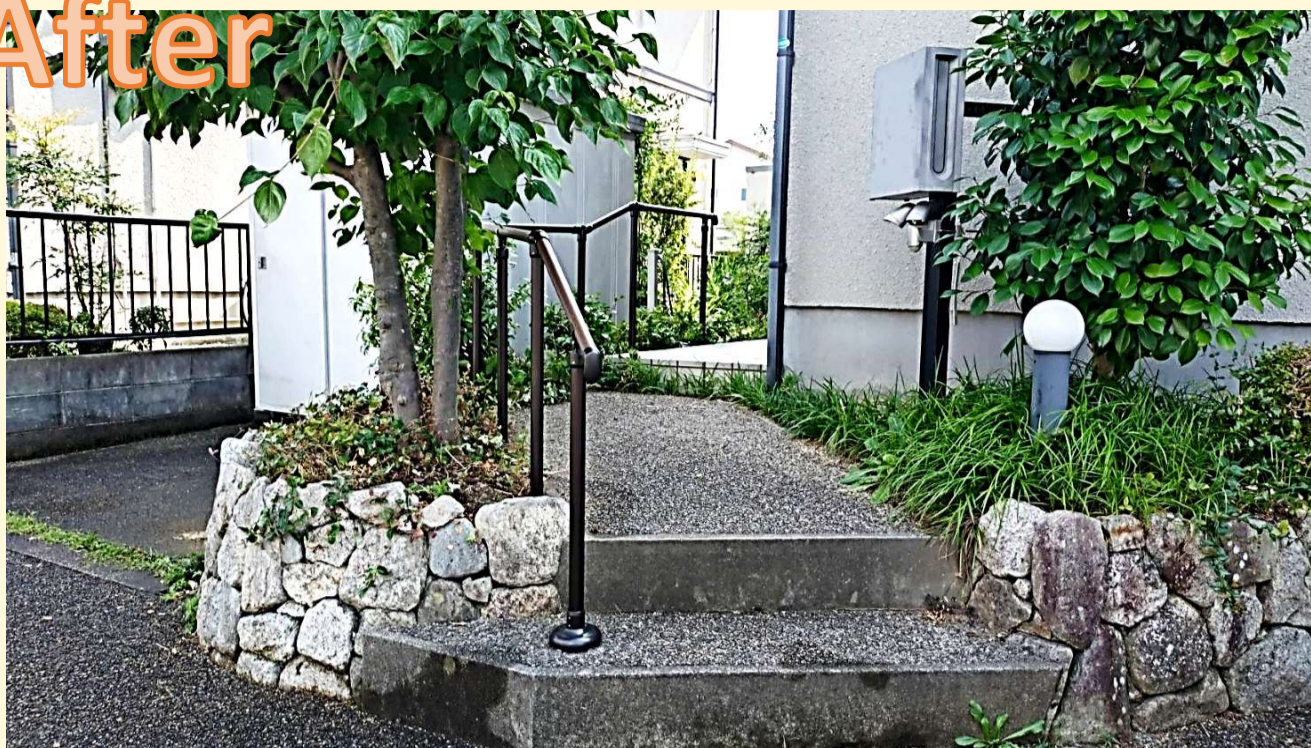
アプローチに沿って手摺を設置し、意匠的にもきれいに仕上がりました！