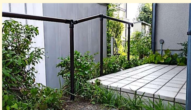
万一の転倒に備えて、玄関ポーチとカーポートとの大きな段差にも手摺が柵となります！