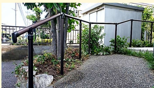
アプローチの高低差、曲がりに合わせて細かく計算して設置しました！