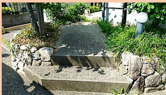
アプローチには手前に2段、玄関ポーチに1段の段差があります。