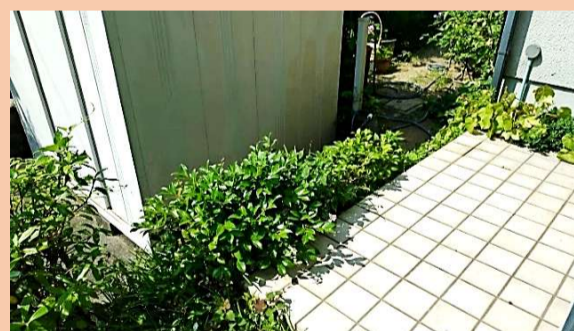
玄関を出てポーチの先はカーポートとの大きな段差があります。