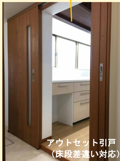
アウトセット引戸 (床段差違い対応)