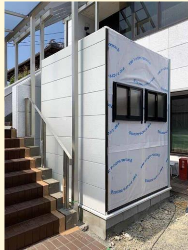
見た目の外観も美しく・・・