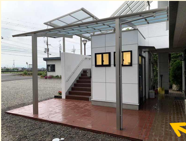
雨が降っても濡れません。だって屋根があるのだもの・・・