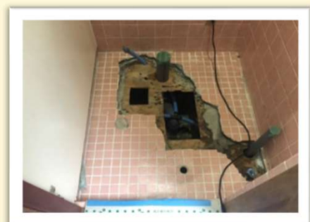
② 床のタイルを解体し、トイレの配管位置を変更しました