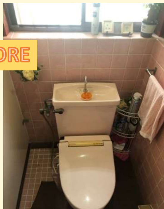
30年間、きれいに使われていたトイレです 床の段差と収納が無いのを気にされてました