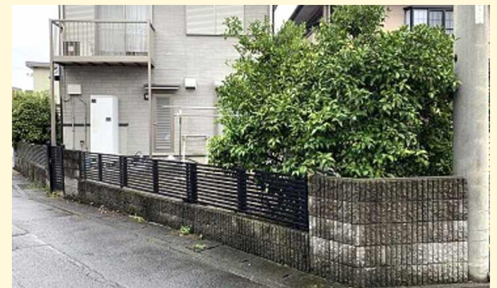
車を駐車させる場所がほしいな・・・