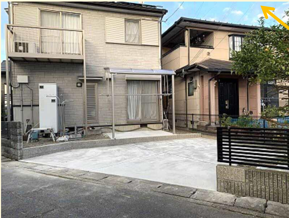
植木はそのまま。 たっぷり駐車できます。