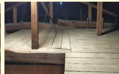
瓦や土をとり除きます。屋根裏の天井も新しくしました。