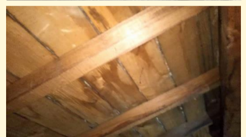
屋根が割れていて雨漏れするのが悩みでした。