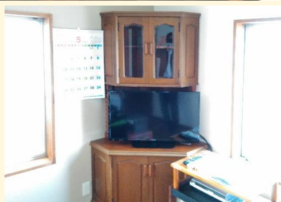
畳をフローリングへ。押入を物入へ。(オーダー品) 暮らしやすくなりました。